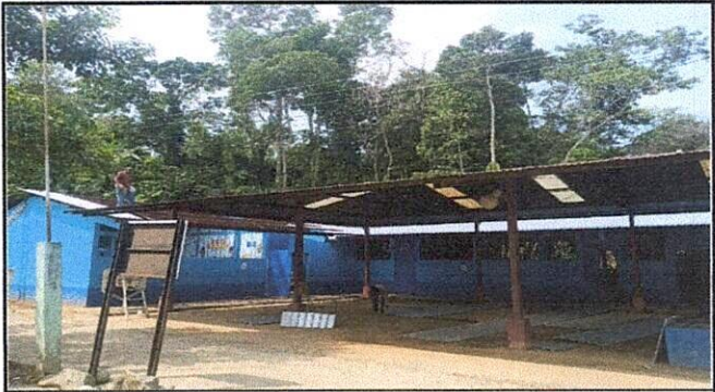
Foto1: Cambio de lamina